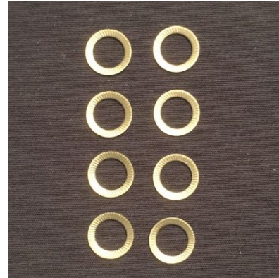
8 x Schnorrscheibe