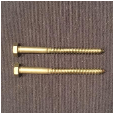
Für die Verschraubung des Kopfes: 2 x 6x70 Holzschrauben