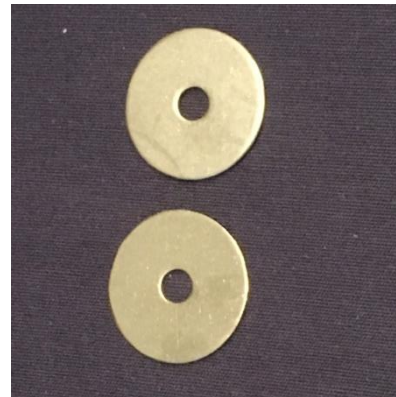
2 x Scheibe 30x6,4