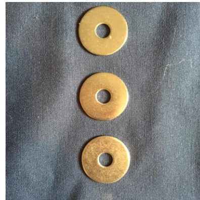
3 x Scheibe 30x8,4