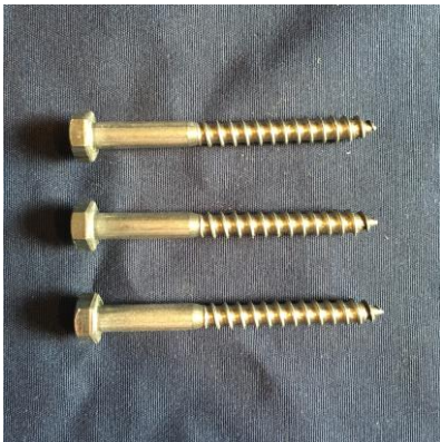
Für die Verschraubung des Kopfes: 3 x 8x70 Holzschrauben